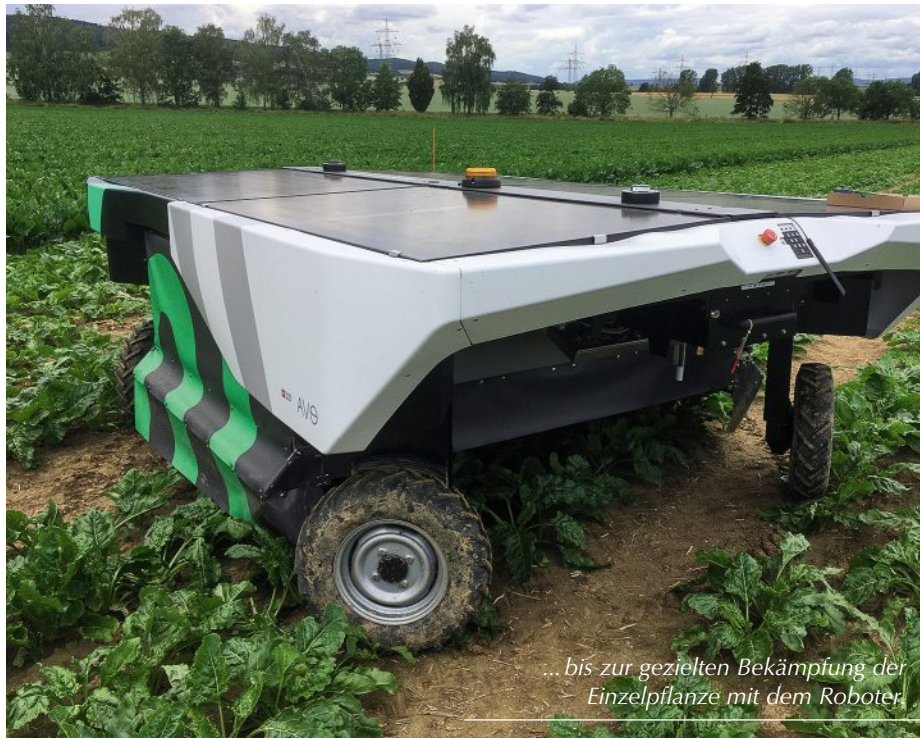
... bis zur gezielten Bekämpfung der Einzelpflanze mit dem Roboter

Totalherbiziden oder zur Kartoffelsikkation. Anders verhält es sich mit kombinierten Verfahren wie der Bandspritzung, die bereits in der Praxis im Einsatz sind.